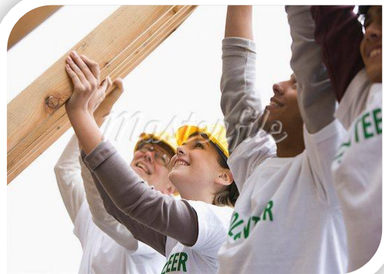
Refection et construction de structures Socio éducatives et culturelles.