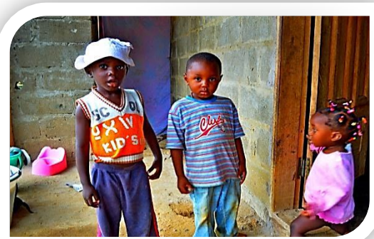
Aide et protection de la petite enfance

C'est aussi l'occasion d'encourager et reconnaître le mérite de ceux, celles, ainsi que les associations qui se font distinguer par leur sens patriotique, leurs talents artistiques, et leurs actions pour la matérialisation de l'émergence dans la région océanaise.