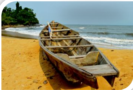
Protection et promotion de l'environnement.