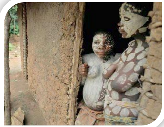
Protection et promotion des peuples et leur culture